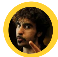
Max Copywriter Video