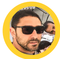
Lorenzo Burlando Video e Fotografia